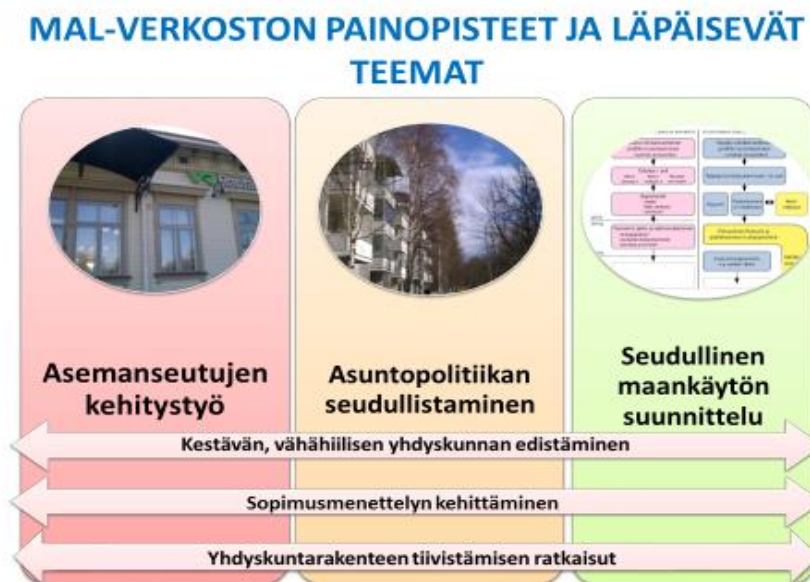
Kuvio 2. MAL-verkoston painopisteet vuodelle 2015 ja toimintaa läpäisevät teemat.

Verkoston vuoden 2015 toimintasuunnitelman runkona olivat jäsenseutujen palautteen ohella ohjausryhmän näkökulmat toiminnallisista painotuksista, muilta sidosryhmiltä saadut näkemykset sekä omat kehittämisideat. Verkoston toiminta keskittyi vuonna 2015 kolmeen temaattiseen painopistealueeseen. Nämä strategiset painopisteet rajattiin kolmeen pääosiioon toimenpiteiden vaikuttavuuden lisäämiseksi. TTS 2015 tavoitteeksi asetettiin, että pääosiioihin kohdistetaan valtakunnallinen seminaari tai workshop. Verkoston painopisteiden toteutusta tuki kolme läpileikkaavaa teemaa, joiden kautta työpajojen ja workshopien tematiikkaa käsiteltiin (kuvio 2.):